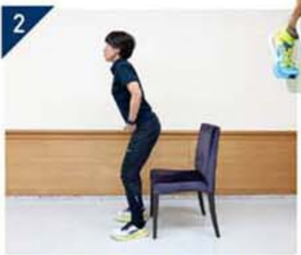
2 手を太ももの付け根にあて、4秒間かけてお尻を後ろに引いていく。 ※手が太ももとお腹に挟まれば、しっかりとお尻が後ろに引けていきます。