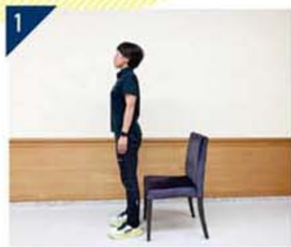
1 椅子の前に立ち、足を肩幅に開く。