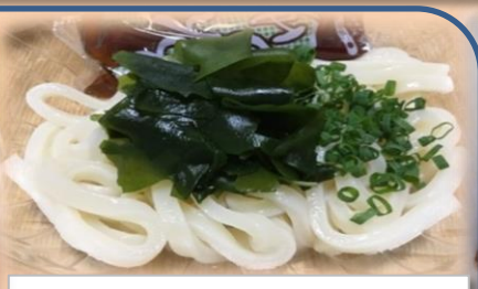
ミニうどん、そば 250円 (無くなり次第終了)