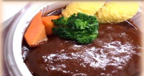
ハンバーグ弁当 600円