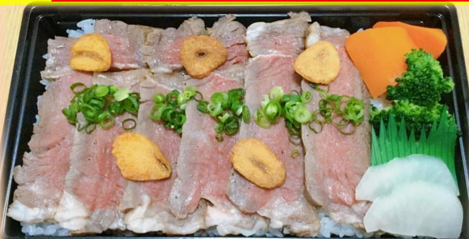
特選サーロインステーキ重 1,200円