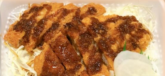
ダブルカツ弁当 700円 チキンカツ&ヒレカツ