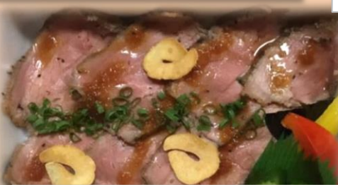
ローストビーフ丼 600円